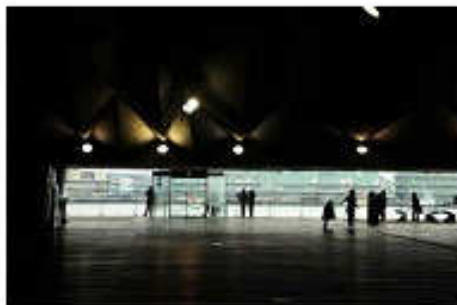
< 画像「画廊」：11枚、某フォトコンテスト金賞受賞作品 >

今年も大変 お世話に なりました 皆様には 良いお年を お迎え下さい マック住研(株)スタッフ一同